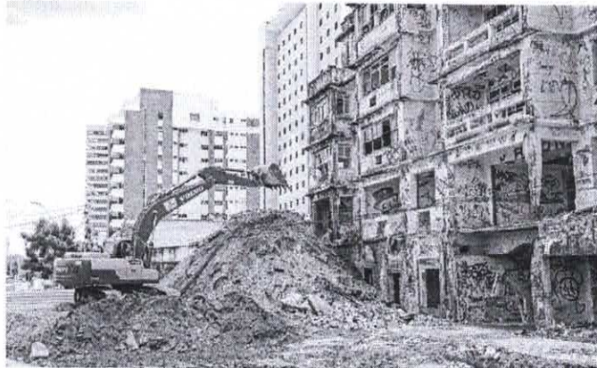
APÓS 12 dias de embargo, a obra de demolição do São Pedro recomeçará