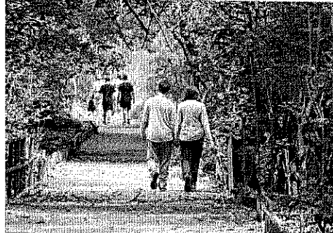
APESAR DE danos às árvores, trilhas estão voltando à normalidade

Apesar de um início de manhã chuvosa, as trilhas do Parque do Cocó, em Fortaleza, concentraram um número considerável de visitantes ontem. Sem precisar enfrentar áreas alagadas — situação que ocorreu após chuva forte no sábado de Carnaval —, os visitantes puderam apreciar todo o trajeto de mais de três quilômetros sem grandes obstáculos.