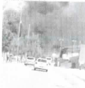
FUMACA escura provocada por incêndio encobriu rodovia