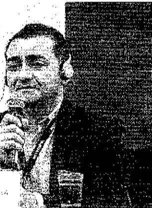
CEO da Brisanet ainda afirmou que início da operação está previsto para outubro

Nosso projeto é piloto. Não é gigante. A construção maior vai ocorrer em 2025. Então, o objetivo é adquirir know how nesse novo segmento