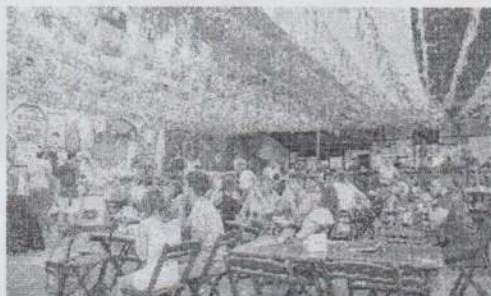
TORCEDORES brasileiros estão procurando bares e restaurantes para assistir aos jogos da Copa do Mundo.

Entre os itens de alimentação com maior saída estão as carnes para churrasco, salgadinhos, aperitivos e pratos prontos congelados. De bebidas, a cerveja é a mais apreciada (50%), seguida pela categoria de vinhos (20%).