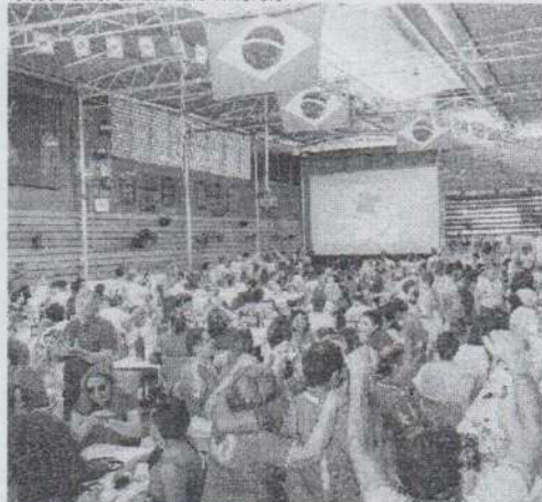
NOS ÚLTIMOS jogos, bares e restaurantes ficaram lotados na Capital