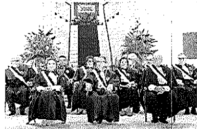
TRT-7 concedeu Medalha de Ordem Alencarina do Mérito Judiciário do Trabalho

ISABELLE MACIEL isabelle.macieli@povo.com.br