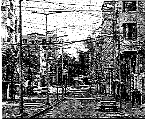
O TOTAL de mortes no conflito entre Israel e Hamas ultrapassa os milhares, segundo as autoridades

ordenar o "cerco total" deste território de 360 km² onde vivem mais de 2 milhões de palestinos.