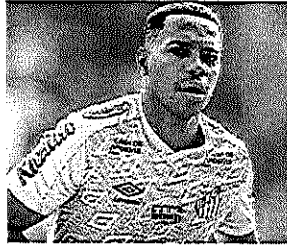
ROBINHO foi condenado por estupro

Robinho teve mais um pedido negado na Justiça brasileira. Na terça-feira, 15, o Superior Tribunal de Justiça (STJ) rejeitou o pedido da defesa do atleta para que a Justiça italiana enviasse ao Brasil uma cópia do processo na íntegra traduzida para o português.