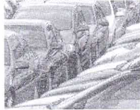
PROGRAMA será analisado até segunda-feira, 5

O pacote de estímulo à produção de carros populares recebeu ontem, 1º, o aval do presidente Luiz Inácio Lula da Silva, informou há pouco o ministro da Fazenda, Fernando Haddad. Ele apresentou ao Palácio do Planalto a versão final do programa, que será analisada pela Casa Civil. O ministº não informou a data de lançamento. Segundo ele, a data dependerá da agenda do presidente Lula e da superação de entraves burocráticos, como pareceres da Receita Federal e da Procuradoria-Geral da Fazenda Nacional. Ele, no entanto, admitiu que espera que a Casa Civil conclua a análise da medida provisória na próxima segunda-feira, 5. Haddad apenas disse que o programa durará "em torno de quatro meses" e