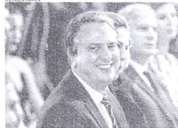
CAMILO fez anúncio em seu perfil no Twitter

Os estudantes de medicina beneficiários do Fundo de Financiamento Estudantil (Fies) poderão financiar até R$ 60 mil por semestre, anunciou ontem, 1º, o ministro da Educação, Camilo Santana. O novo valor representa um reajuste de 20,8% em relação ao teto anterior, que estava em R$ 49,6 mil semestrais. Em vídeo postado nas redes sociais, Santana disse que a decisão foi tomada para evitar a desistência de estudantes que não conseguiram arcar com as mensalidades do curso de medicina. Segundo o ministro, a determinação partiu do presidente Luiz Inácio Lula da Silva. "Uma boa notícia para os nossos estudantes. O Comitê Gestor do Fies deliberou hoje o aumento do limite para o financiamento do curso de Medicina, elevando o valor para R$60 mil por semestre. O novo teto passará a valer a partir de 14 de junho", afirmou Camilo Santana em postagem em seu perfil no Twitter. O novo teto entrará em vigor no próximo dia 14 e será aplicado não apenas aos novos financiamentos, mas aos financiamentos a estudantes já matriculados. Responsável por gerir o Fies, o Fundo Nacional de Desenvolvimento da Educação (FNDE) informou que o novo teto valerá apenas para