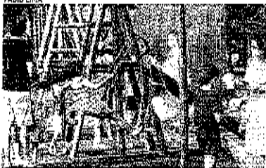
LOCAL oferece várias opções de lazer ao ar livre

Domingo, fim de tarde, e o céu semi nublado quase sempre enche a animação tranquila, afim de segunda-feira de trabalho e estada para muita gente. Quem mora na cidade tem como boa opção a Praça Luíza Távora. No entorno, de tempos em tempos a praça se enche de gente vindo de diversos bairros em busca de uma programação diversificada.